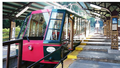
※ケーブル坂本駅より

このケーブルカーは日本最長だそうで、赤と緑のレトロな車両が目を引いてかわいいです。登っていく間、途中で駅があったり、トンネルがあったりするので乗車中も楽しい気分を味わえます。頂上のケーブル延暦寺駅に着くと、びわ湖の景観を楽しめます♪ケーブル延暦寺駅より、自然豊かな道を通って比叡山延暦寺へ歩いて行くことができます。山の上なのでひんやりしていて夏場のお出かけに良さそうです。とてもおすすめです～(^^)